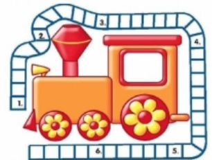
Ответы: 1. Англия 2. Платформ 3. Проводник 4. Электронка 5. Рельсы 6. Вагон